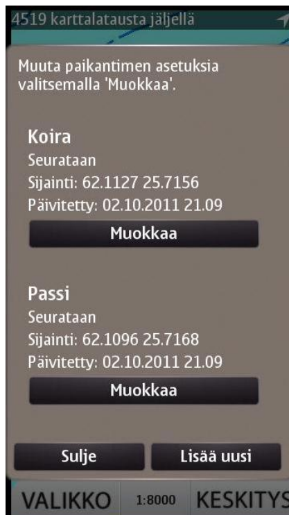
Kuva 9 Paikanninlistaus