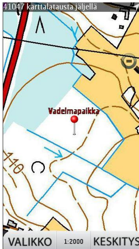
Kuva 7 Tallennettu reittipiste