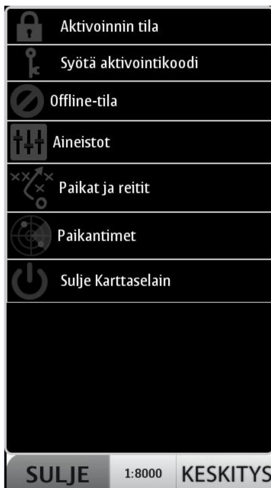
Kuva 2 Karttaselaimen toimintovalikko