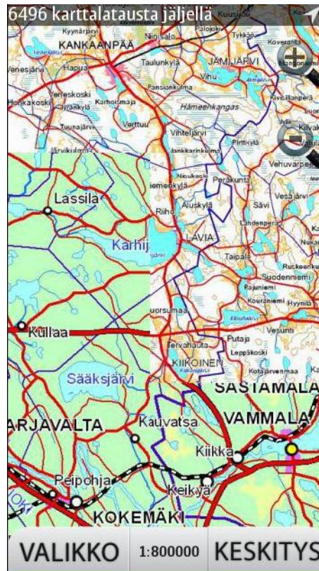
Kuva 5 Muuttuneet aineistot

Mikäli muuttuneet aineistot halutaan korvata uusilla, tulee Karttaselaimen välimuisti tyhjentää 1:80000 ja sitä suuremmilta mittakaavoilta. Tyhjennyksen voi suorittaa esimerkiksi tietokoneella kytkemällä puhelimen tietokoneeseen ja avaamalla karttaselaimen välimuistihakemiston (E:\karttaselain.cache). Tyhjennettävät hakemistot ovat seuraavat: