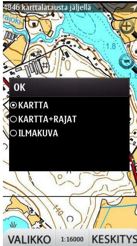
Kuva 3 Aineistot-valikko

Allaolevassa kuvassa näkyy kiinteistörajojen esitystapa Karttaselaimessa.