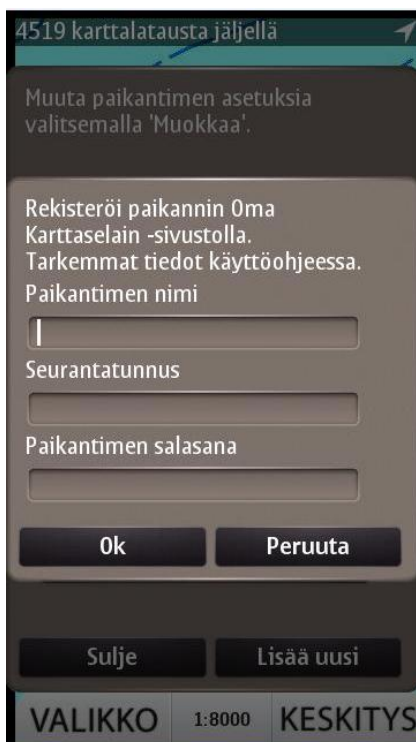
Kuva 8 Paikantimen lisääminen