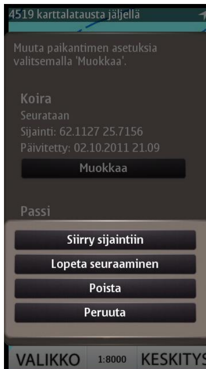
Kuva 10 Paikantimen toiminnot

Toimintovalikossa voi paikantimelle tehdä seuraavat toimenpiteet: