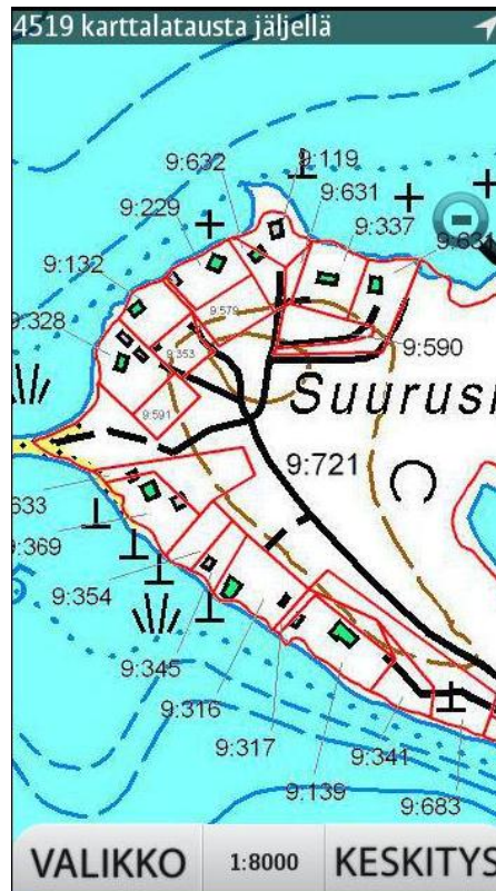
Kuva 4 Kiinteistörajat